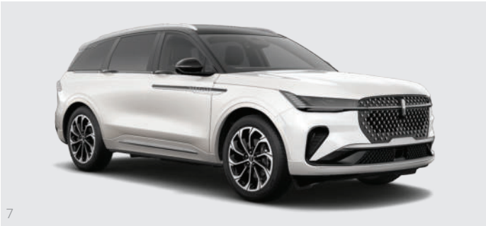
7 White Platinum