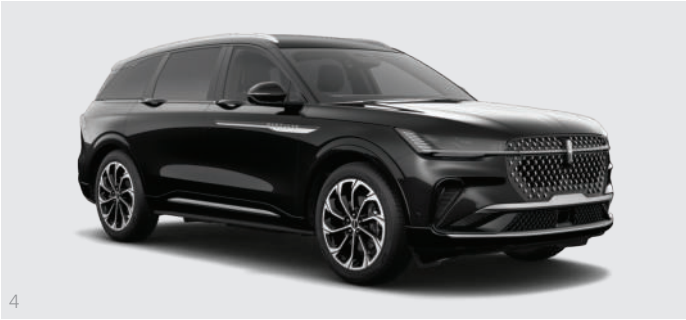
4 Infinite Black