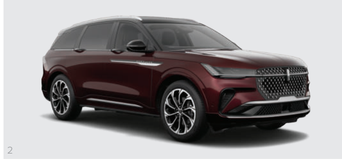
2 Diamond Red