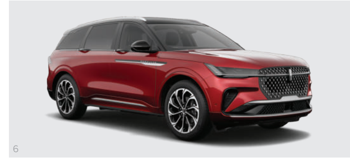
6 Red Carpet