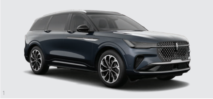
1 Blue Panther