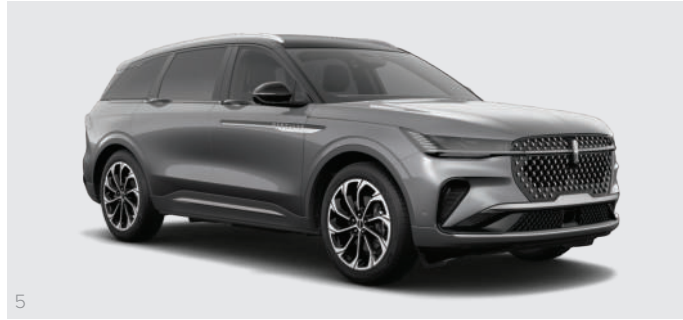
5 Lustrous Gray