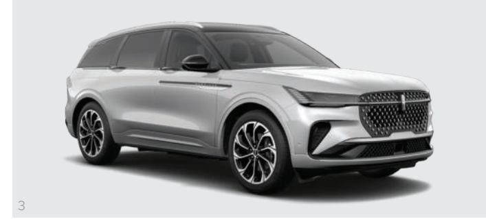
3 Silver Radiance